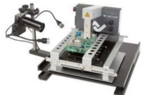
HR 200 с видеокамерой мониторинга пайки