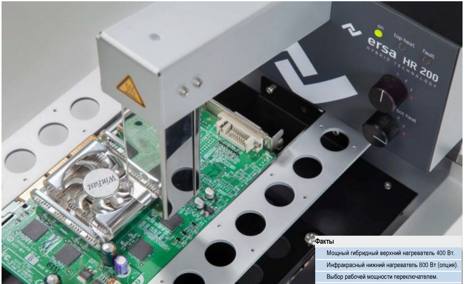
Вид на печатную плату в рамочном держателе под верхним (гибридным) нагревателем системы HR 200

Распаковал и работай – просто, как дважды два!