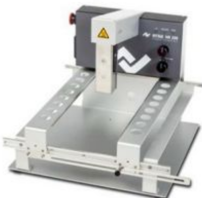
HR 200 в минимальной комплектации

HR 200 пригодится для работ с SMT компонентами на печатных платах малого и среднего размеров: основные параметры приведены на обороте листа. Две базовые комплектации можно дополнять опциями согласно технической необходимости и бюджету. Оператор задает рабочую мощность одного или двух излучателей, включает нагрев нажатием на педаль (руки свободны), и через пару минут операция ремонтной пайки выполнена: см. таблицу на обороте.