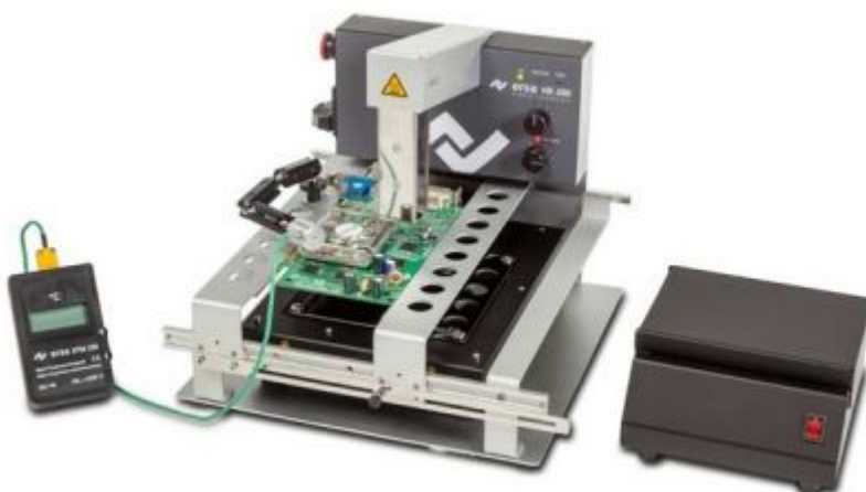
Опции: контрольный термометр (слева) и вентилятор для охлаждения плат после пайки (справа)