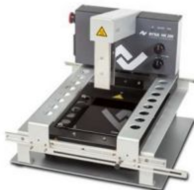
HR 200 в комплекте с нижним нагревателем