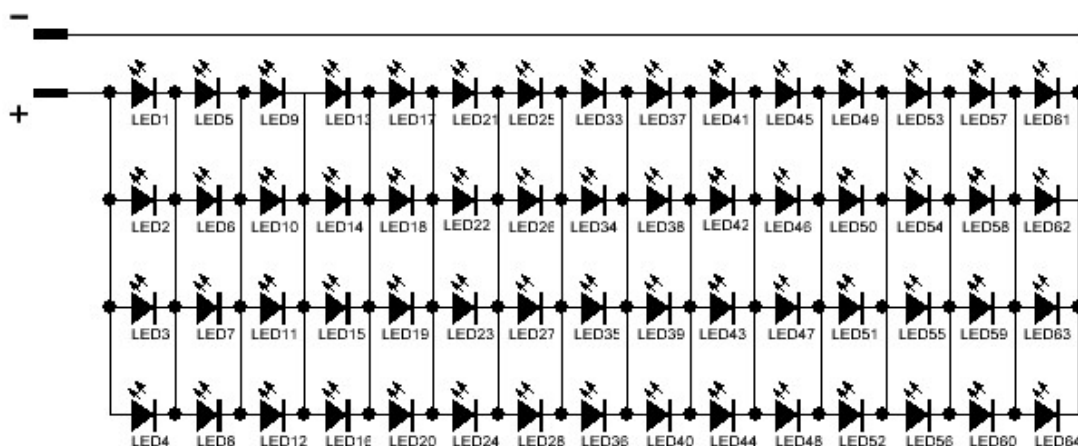
Рис. 1 Принципиальная схема светодиодного модуля ALC222.49.64-х-LM302D-XXXX